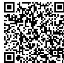
หรือสแกน QR CODE

https://serv.inventech.co.th/WHAUP176700R/#/homepage